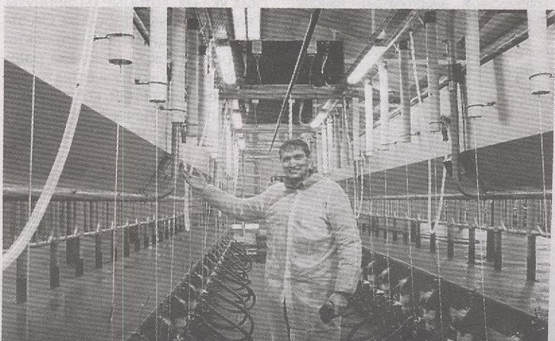
Молодые специалисты приходят работать в сельское хозяйство